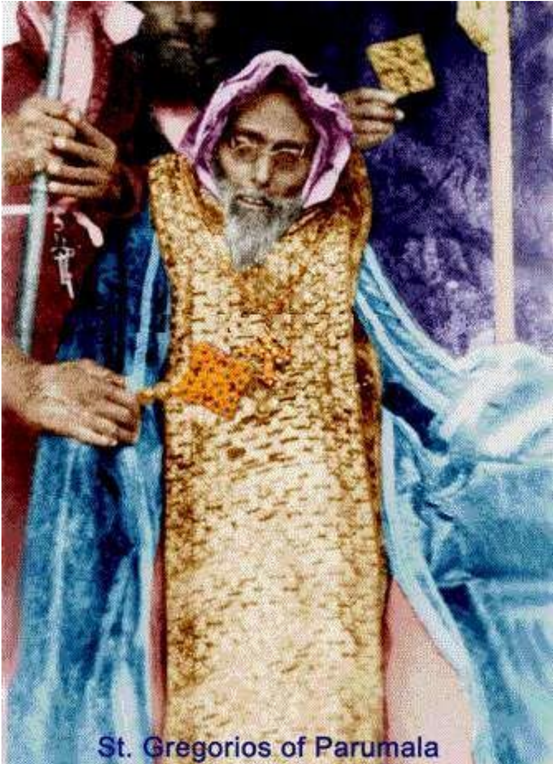
St. Gregorios of Parumala

നടത്തുന്നു. ഈ ശുശ്രൂഷകൾ നടത്തിയശേഷം, പഴയ നിയമത്തിൽനിന്നും പുതിയ നിയമത്തിൽനിന്നുമുള്ള വായനകളും മൃതദേഹാഘോഷണവും കഴിഞ്ഞ് എല്ലാവരും കൈമുത്തുന്നു. തുടർന്ന് പ്രാർത്ഥനയോടുകൂടി സൈത്തൊഴിച്ച് മുടി, കല്ലറയിൽ വച്ച് സംസ്കരിക്കുന്നു.)